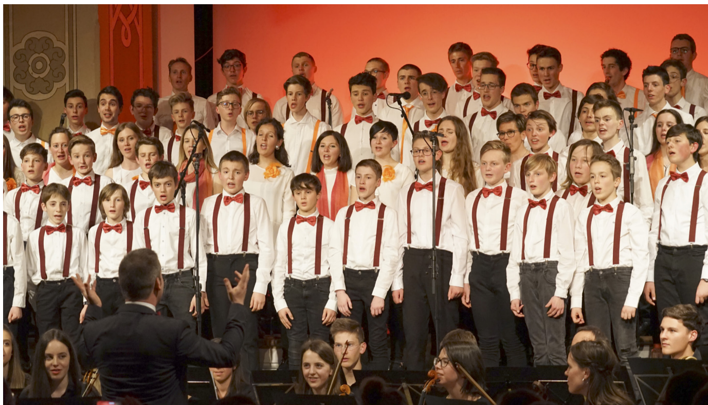
Selten zuvor war eine Veranstaltung im Parzivalsaal so gut besucht wie die beiden „Hymns of Worship“-Konzerte des Vinzentiner Knabenchors in Kooperation mit dem Jugendchor Kyrios aus Badia. Gemeinsam mit einem Orchester und einer Rockband begeisterten die beiden Chöre mit gospelartigen Lobeshymnen aus den Vereinigten Staaten von Amerika.

Im Rahmen der Steuererklärung kann die 5-Promille-Quote gemeinnützigen Organisationen zugesprochen werden. Sowohl der Absolventenverein „Die Vinzentiner“ (Str.-Nr. 90011050219) als auch die Stiftung Vinzentinum pro futuro (Str.-Nr. 92046280217) sind bezugsberechtigt. Die Zuwendung erfolgt, indem bei der Steuererklärung die Steuernummer der entsprechenden Organisation angegeben wird.