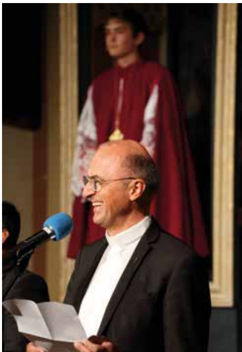
Festakt „150 Jahre Vinzentinum“: Jubiläumsfeier während seiner Amtszeit

ratung zugute. Sofern es seine übrigen Verpflichtungen zuließen, stand er gerne Gottesdiensten im Haus vor und verstand es dabei, junge Menschen mit anschaulichen und treffenden Worten und Bildern anzusprechen und ihnen hilfreiche Impulse für ihr Leben mitzugeben. Er ging stets offen auf Menschen zu und vermochte es, sie mit seinem Optimismus anzustecken. Gerne erzählte er von seiner eigenen Studentenzeit und wusste dabei viele nette und erheiternde Anekdoten zu berichten.