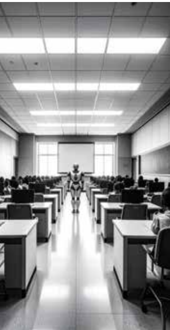
Wo KI endet, beginnt Bildung

Angesichts der rasanten Entwicklung im Bereich der künstlichen Intelligenz sind gerade Heranwachsende deshalb gut beraten, sich von Immanuel Kant wieder neu zurufen zu lassen: „Sapere aude! Habe Mut dich deines eigenen Verstandes zu bedienen!“, damit der seit der Aufklärung konsequent begangene und mühsam errungene „Ausgang des Menschen aus seiner selbstverschuldeten Unmündigkeit“