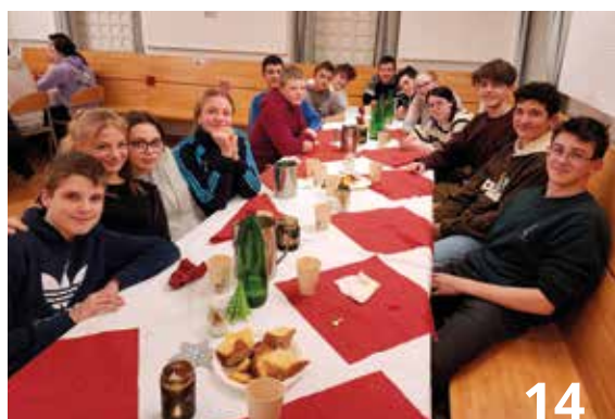
08 Bouldern in der Kletterhalle | 09 Puzzeling | 10 Beim Rosenkranzknüpfen | 11 Knifflige Fälle beim Krimdinner 12 In der Popcornfabrik | 13 Christbaum schmücken zu Weihnachten | 14 Weihnachtsfeier des Internats