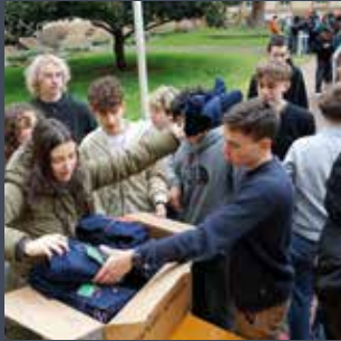
02 Die neuen Sets waren heißbegehrt.