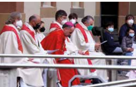
Coronapandemie: Regens in einer herausfordernden Zeit für Schule und Internat