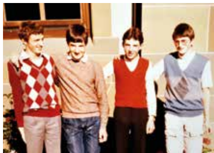
Heimschüler in den 1980er-Jahren: Mit Freunden im Internat