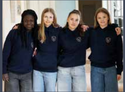
04 Vinzentiner Gemeinschaft im Zeichen des „V“