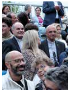
Großereignis: Beim Symphoniacs-Konzert