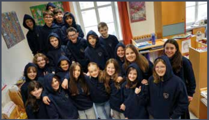
03 Die Klasse 1B im einheitlichen Vinzlook